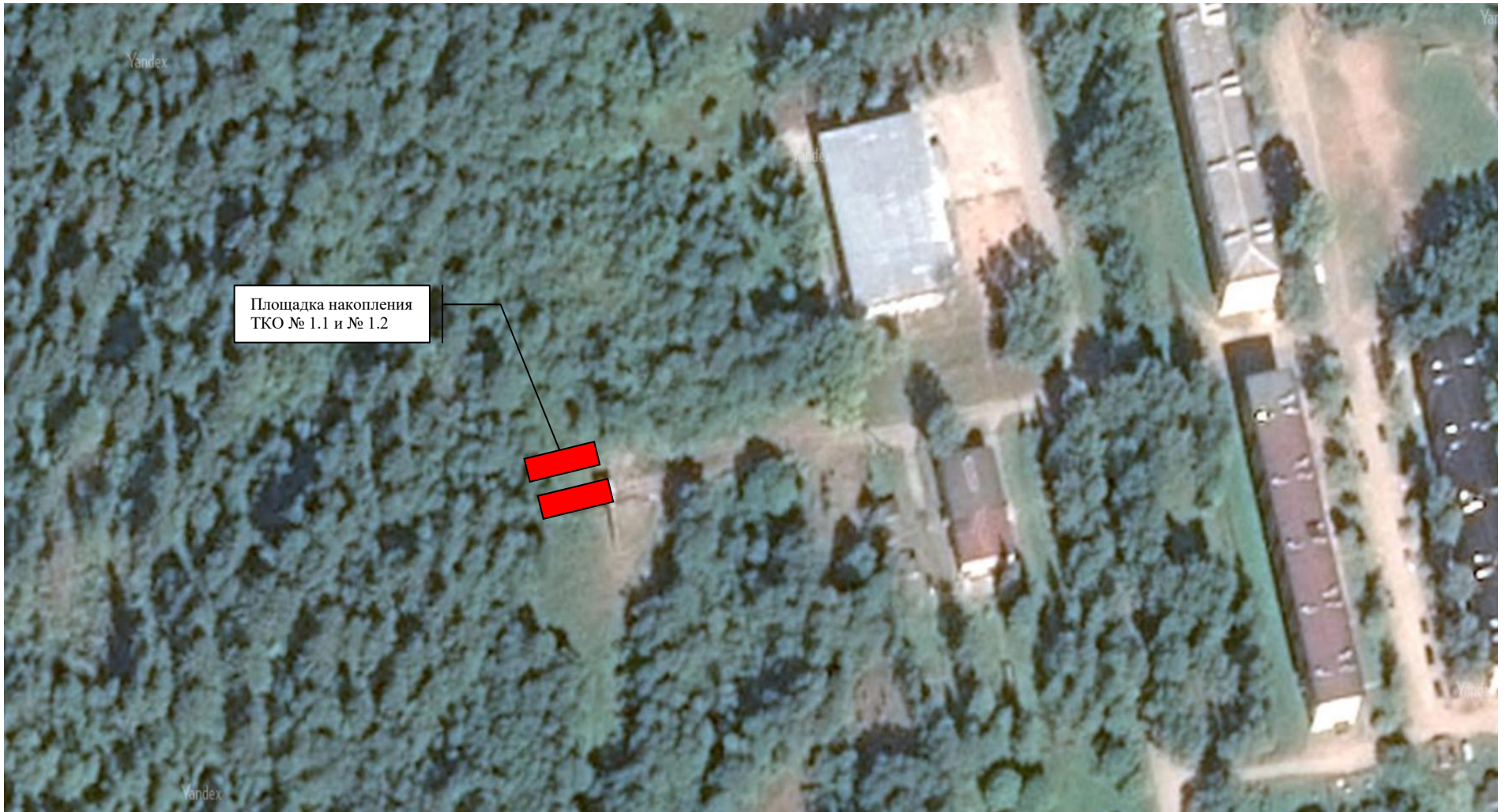
СХЕМА расположения мест (площадок) накопления твердых коммунальных отходов в д. Большое Городно